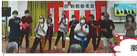
インドネシアのダンスを披露