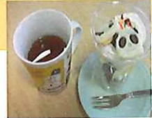
パフェケーキ作りました おいしかったです！